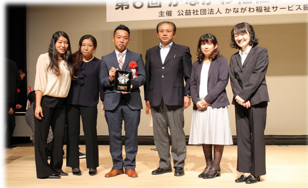
～ 「そらとうみとたいよう」とプロジェクトメンバー ～